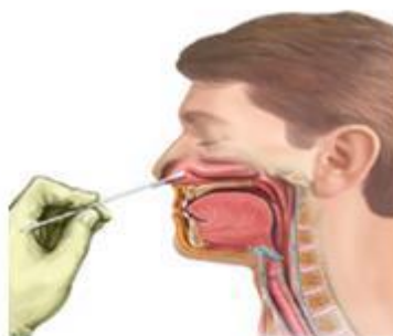
Hình 3: Lấy mẫu dịch ngoáy mũi